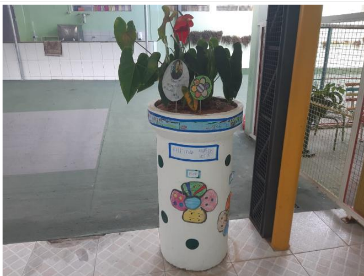
REVITALIZAÇÃO DA ÁREA EXTERNA