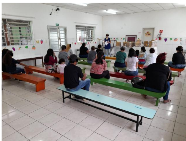
REUNIÃO DE PAIS - PRÉ II