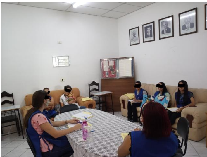
TFC BRINCADEIRAS NA EDUCAÇÃO INFANTIL