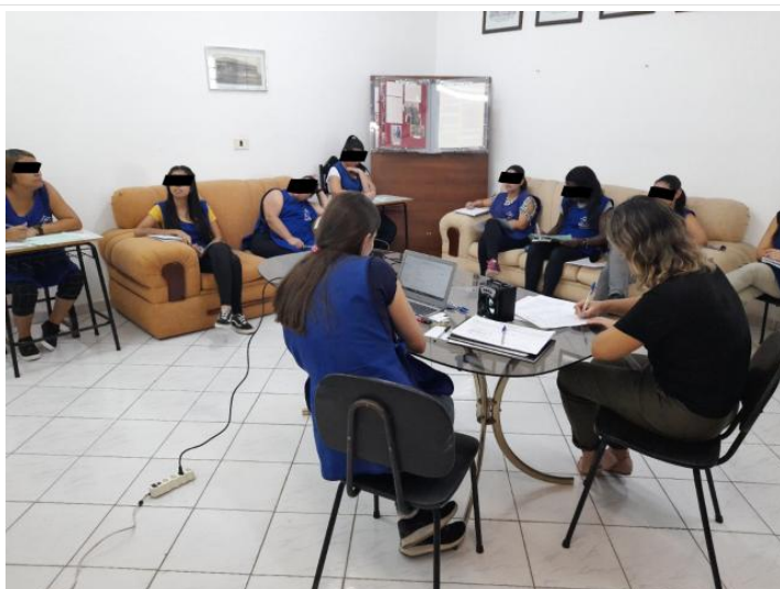
TFC PRIMEIRA INFÂNCIA E DOCUMENTOS NORTEADORES