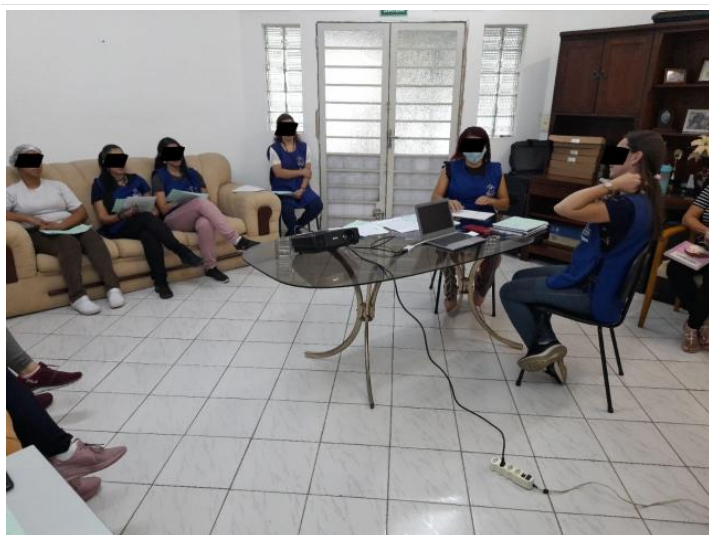
TFC PRIMEIRA INFÂNCIA E DOCUMENTOS NORTEADORES