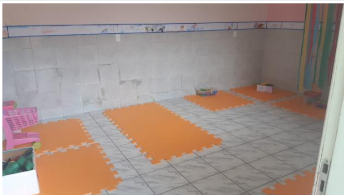
REVITALIZAÇÃO - ESPAÇO (SALA PARA BEBÊS E CRIANÇAS PEQUENAS)