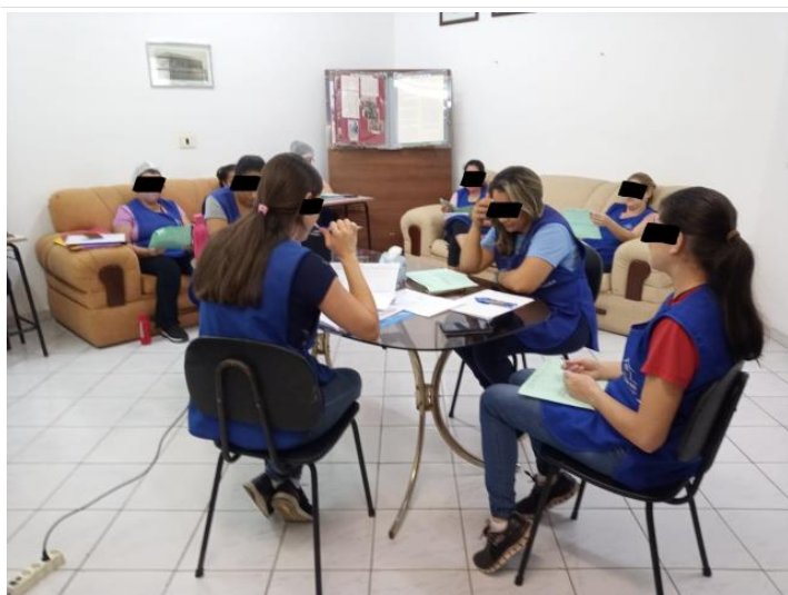
TFC ORIENTAÇÕES PARA COMPARTILHAMENTO DE DOCUMENTOS NO GOOGLE DRIVE