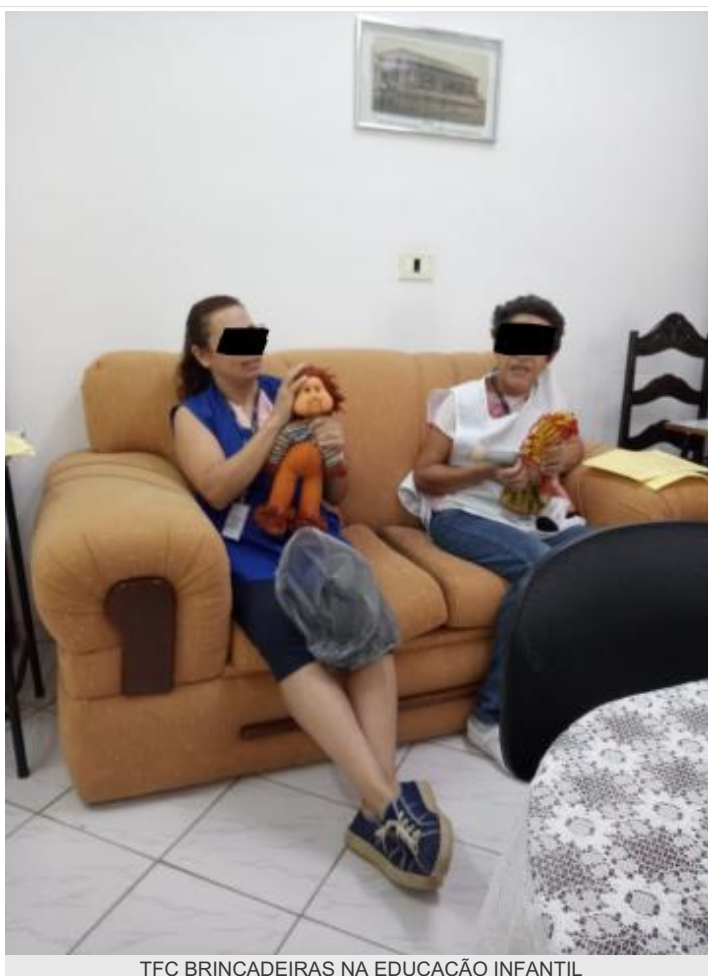
TFC BRINCADEIRAS NA EDUCAÇÃO INFANTIL