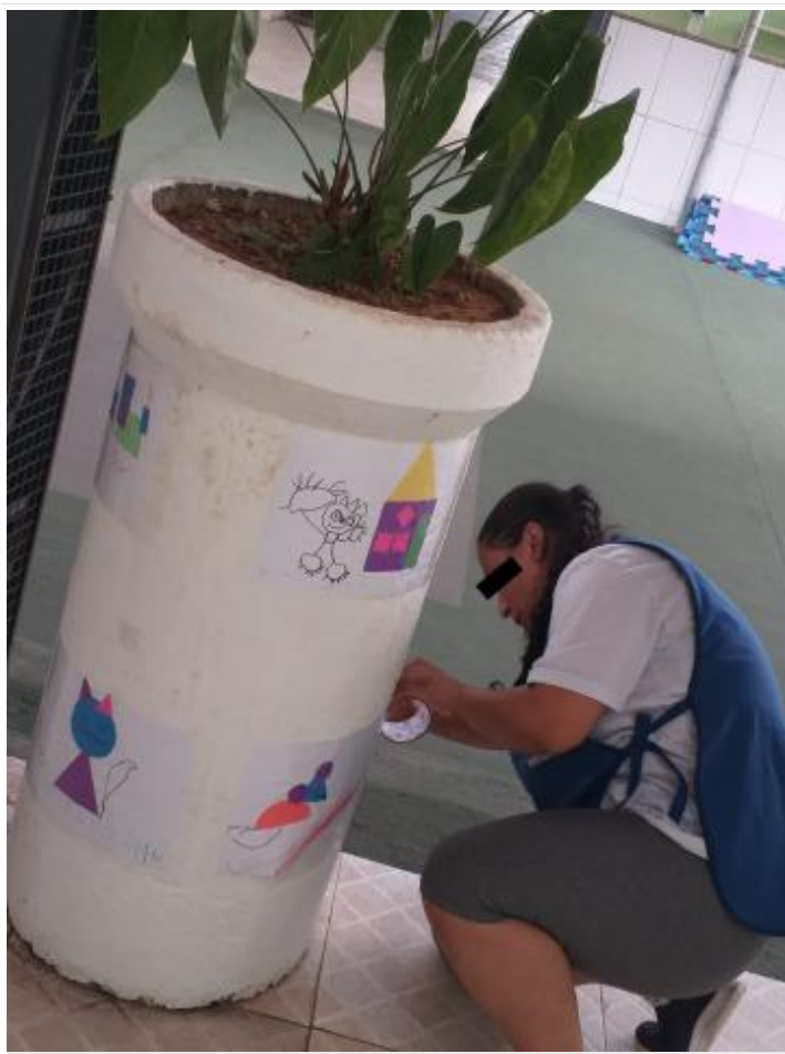
REVITALIZAÇÃO DA ÁREA EXTERNA