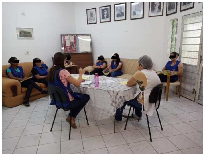
TFC BRINCADEIRAS NA EDUCAÇÃO INFANTIL