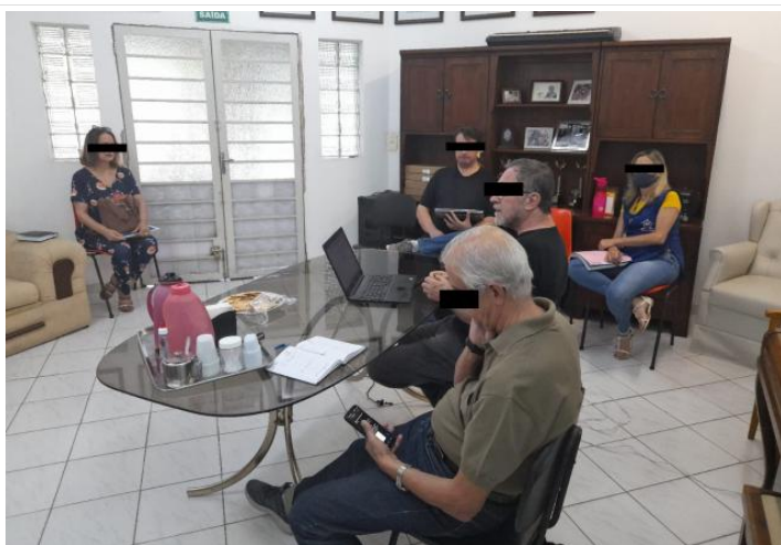
REUNIÃO DA DIRETORIA - REESTRUTURAÇÃO DO SITE